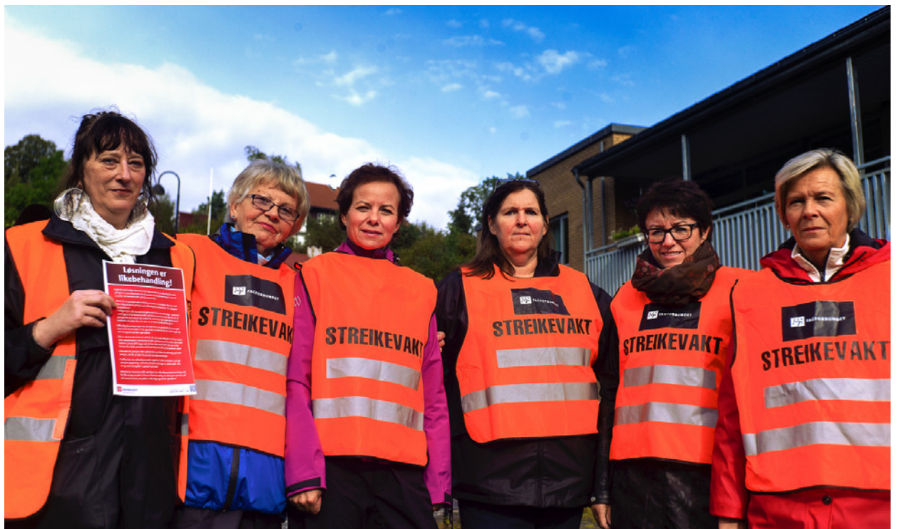
Streikevakt: God stemning blant streikevaktene ved Søreide sykehjem.

– Det er fagbevegelsen som kommer til å føre an i EØS-kampen de kommende årene. Vi skal huske på at det var LO-kongressen som banet vei for det første norske vetoet mot et EU-direktiv noensinne, nemlig postdirektivet. Så lenge EØS-avtalen fortsetter å gripe inn i norsk arbeidsliv og forringer faglige rettigheter, vil EØS-motstanden i LO bare vokse, avslutter Skårderud.