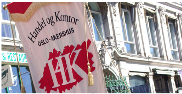
Handel og Kontor: LOs tredje største forbund har landsmøte 15. - 19. september.