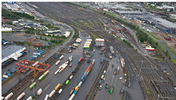
Alnabru: Her planlegges godsterminalen.