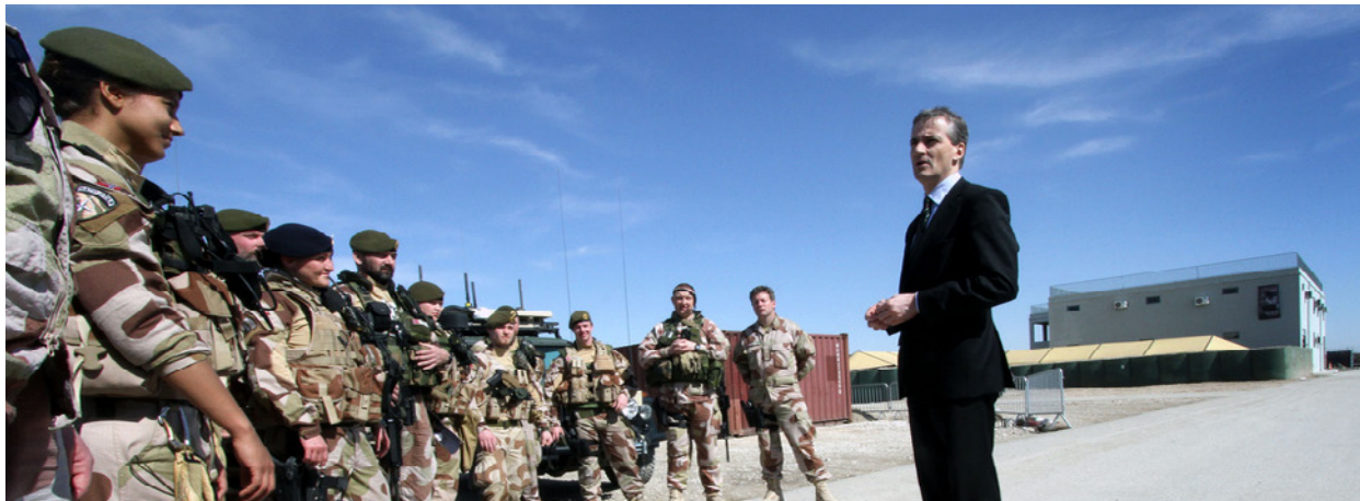
Camp Nidaros: Jonas Gahr Støre møter norske soldater i Afghanistan.