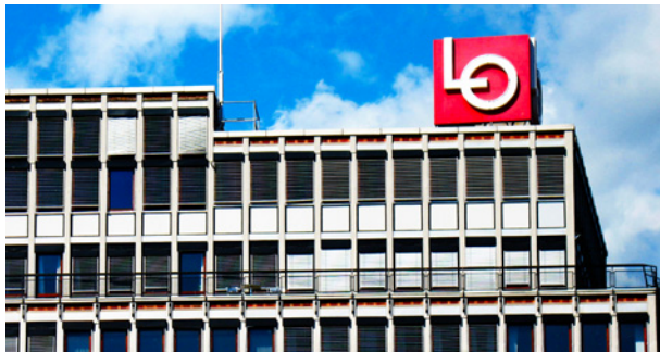
LO: Forbundsledere krever offensiv klimapolitikk.